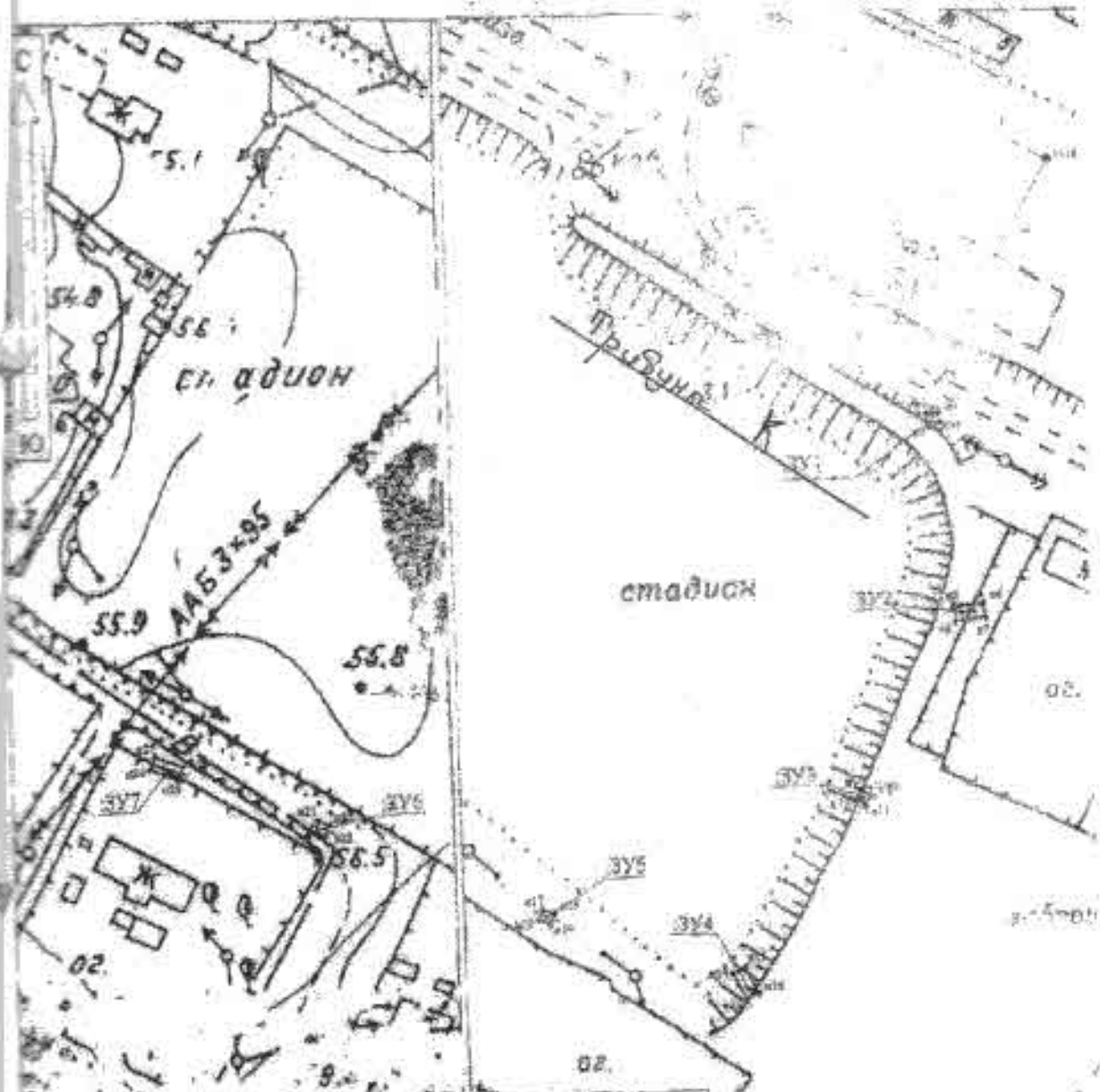
Схема расположения земельного участка